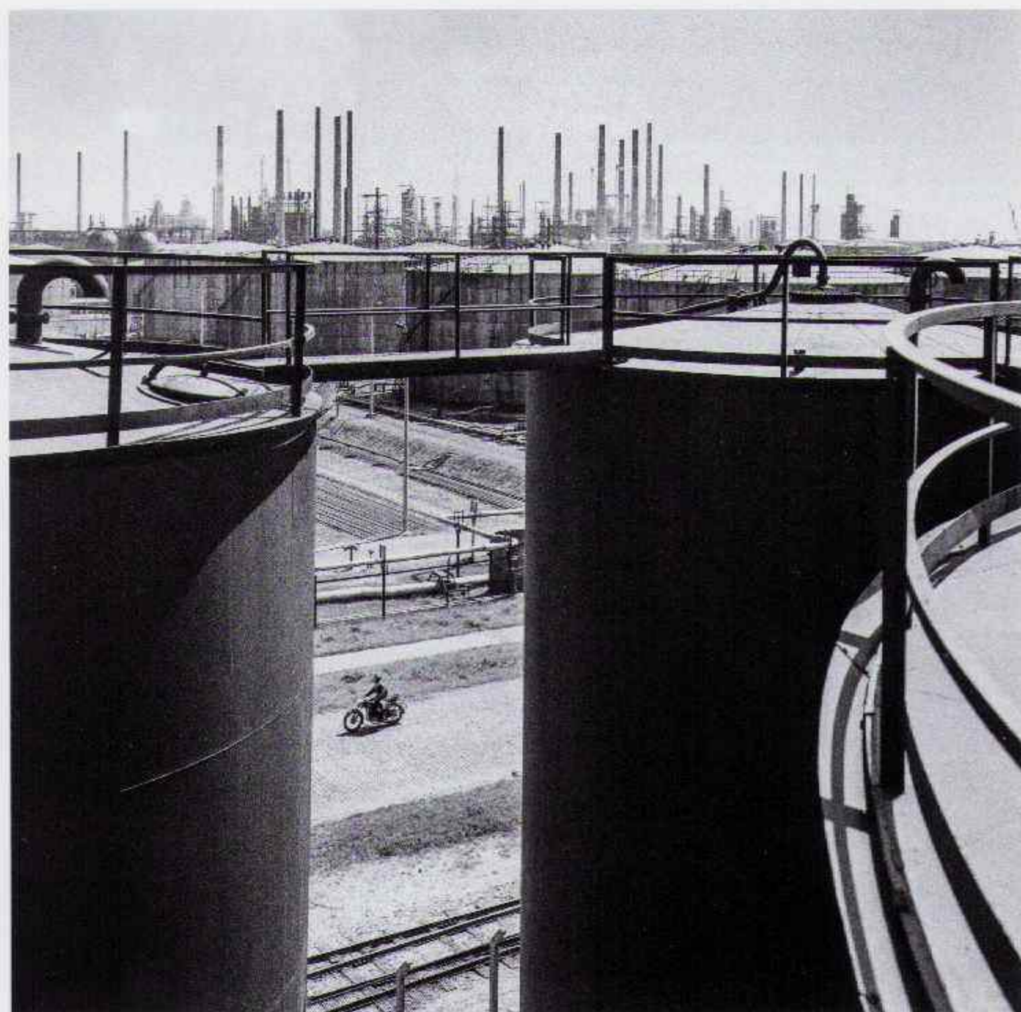
Peisaj industrial din Rotterdam. Cas Oorthuys, Vondelingenweg, 1957-1958.